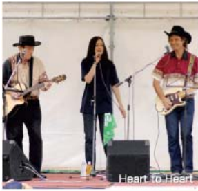
Heart to Heart