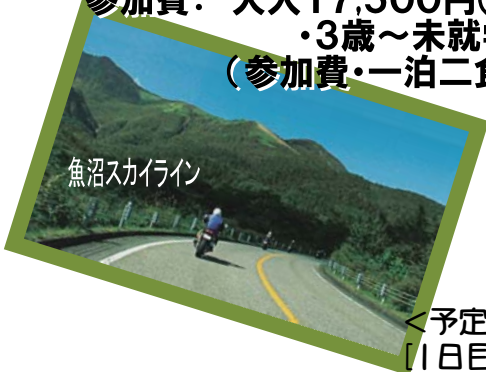
魚沼スカイライン